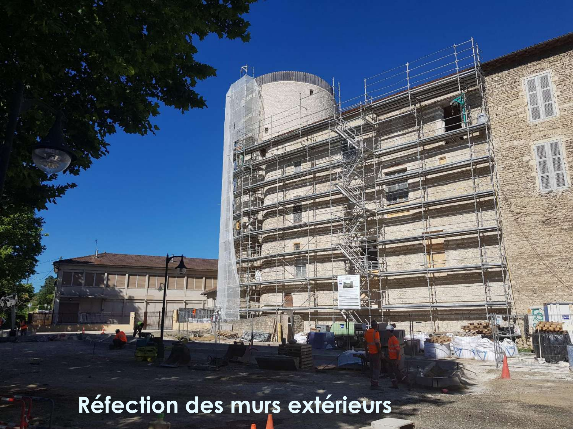
Réfection des murs extérieurs

MOSAÏQUE & GALERIE POUR LE RE DE LA COMMUNE DE MONUMENT HISTORIQUE