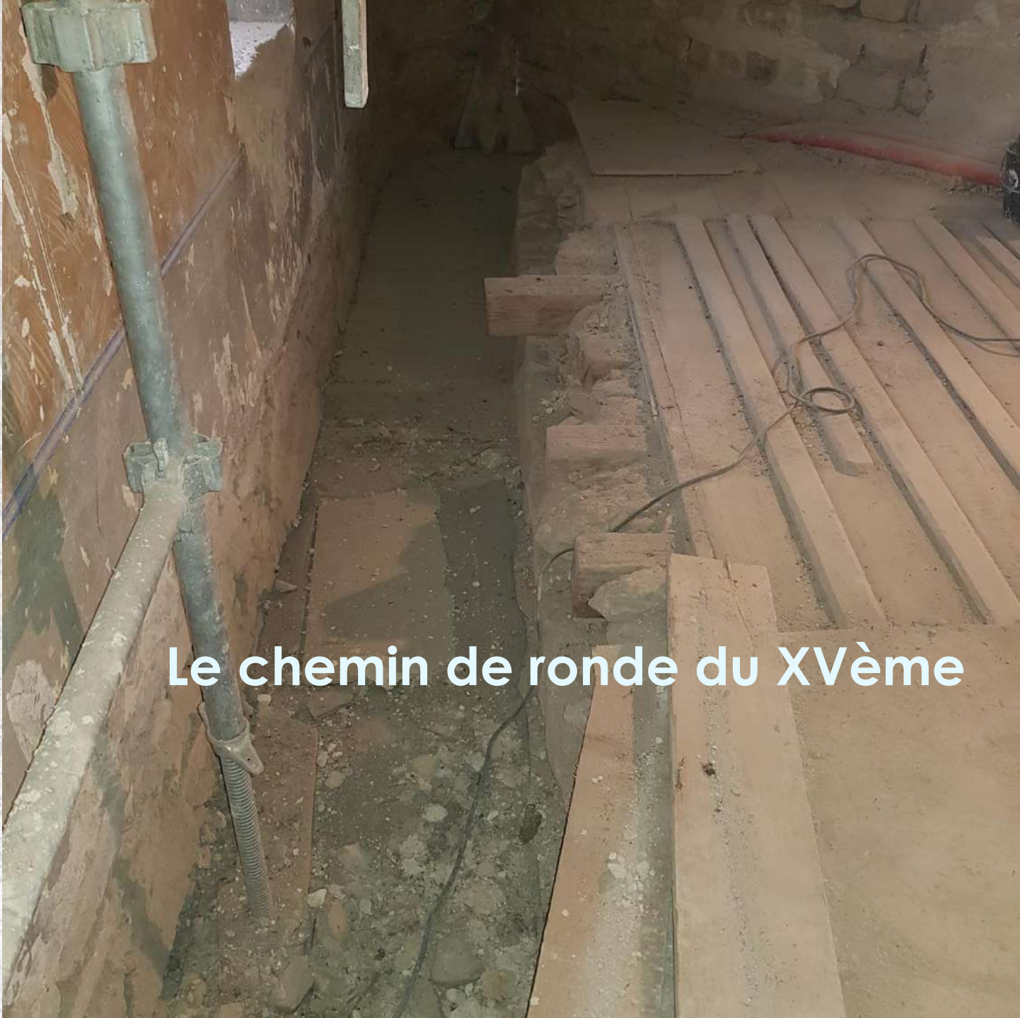
Le chemin de ronde du XVème