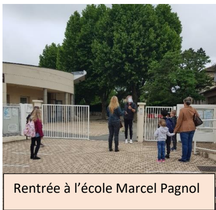
Rentrée à l'école Marcel Pagnol

Le 12 mai dernier, les élèves de la Commune ont repris le chemin de l'école ! Après les deux mois de confinement imposés par la crise sanitaire, la réouverture des écoles ne pouvait être effective qu'en tenant compte des consignes gouvernementales, imposant des règles sanitaires strictes : la mise en œuvre des gestes barrières au sein des établissements d'accueil, et surtout un nombre maximum d'enfants dans les classes (10 en école maternelle, 15 en école élémentaire).