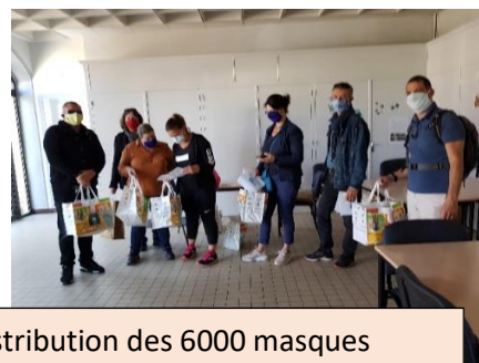
Distribution des 6000 masques

De plus, la Municipalité a acheté tissu et élastiques pour offrir la possibilité à des Ansois volontaires d'en confectionner : à ce jour, plus de 2000 masques grand public en tissu ont pu être mis à disposition de la population et des professionnels.