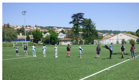
Les élémentaires se préparent à aller déjeuner