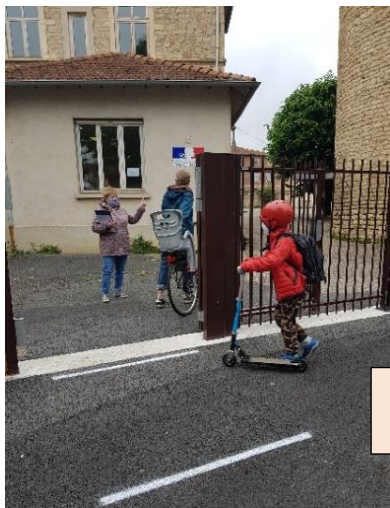
Rentrée à l'école René Cassin

Ainsi, au mois de mai, ce sont 331 enfants de 4 à 10 ans qui ont retrouvé leur enseignant et une partie de leurs copains en classe, dont la moitié a fréquenté l'Accueil non-scolaire mis en place par la Commune.